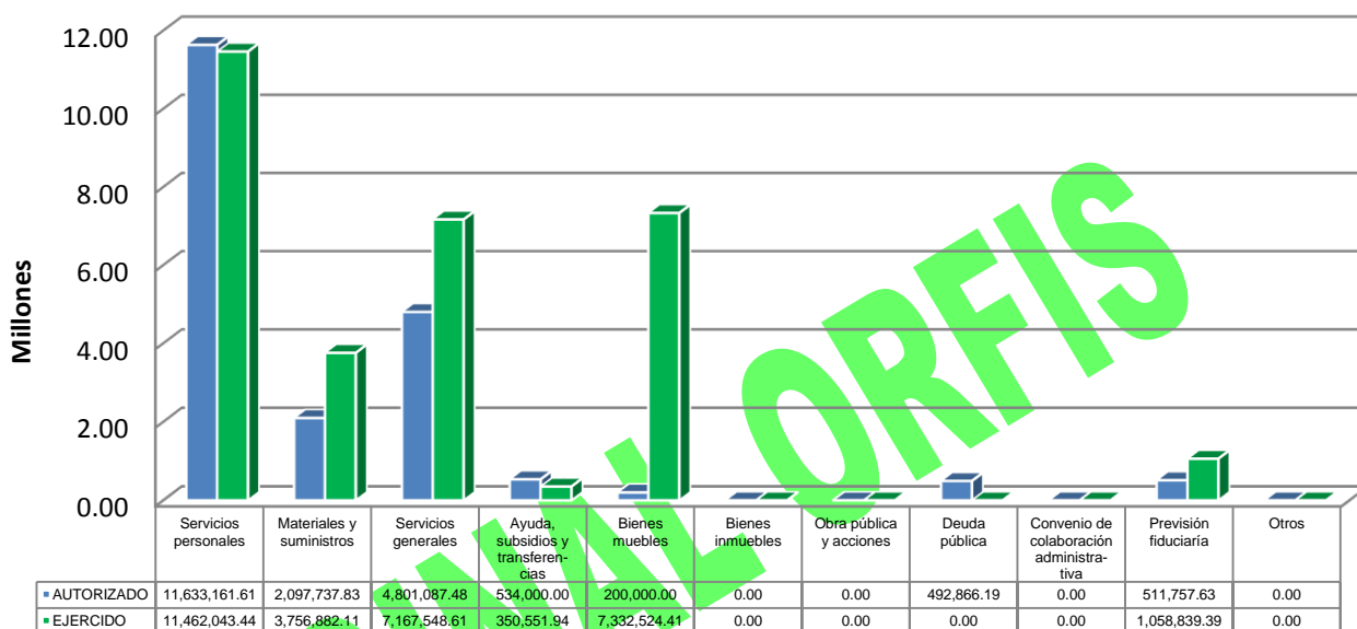
GRÁFICA 2 EGRESOS